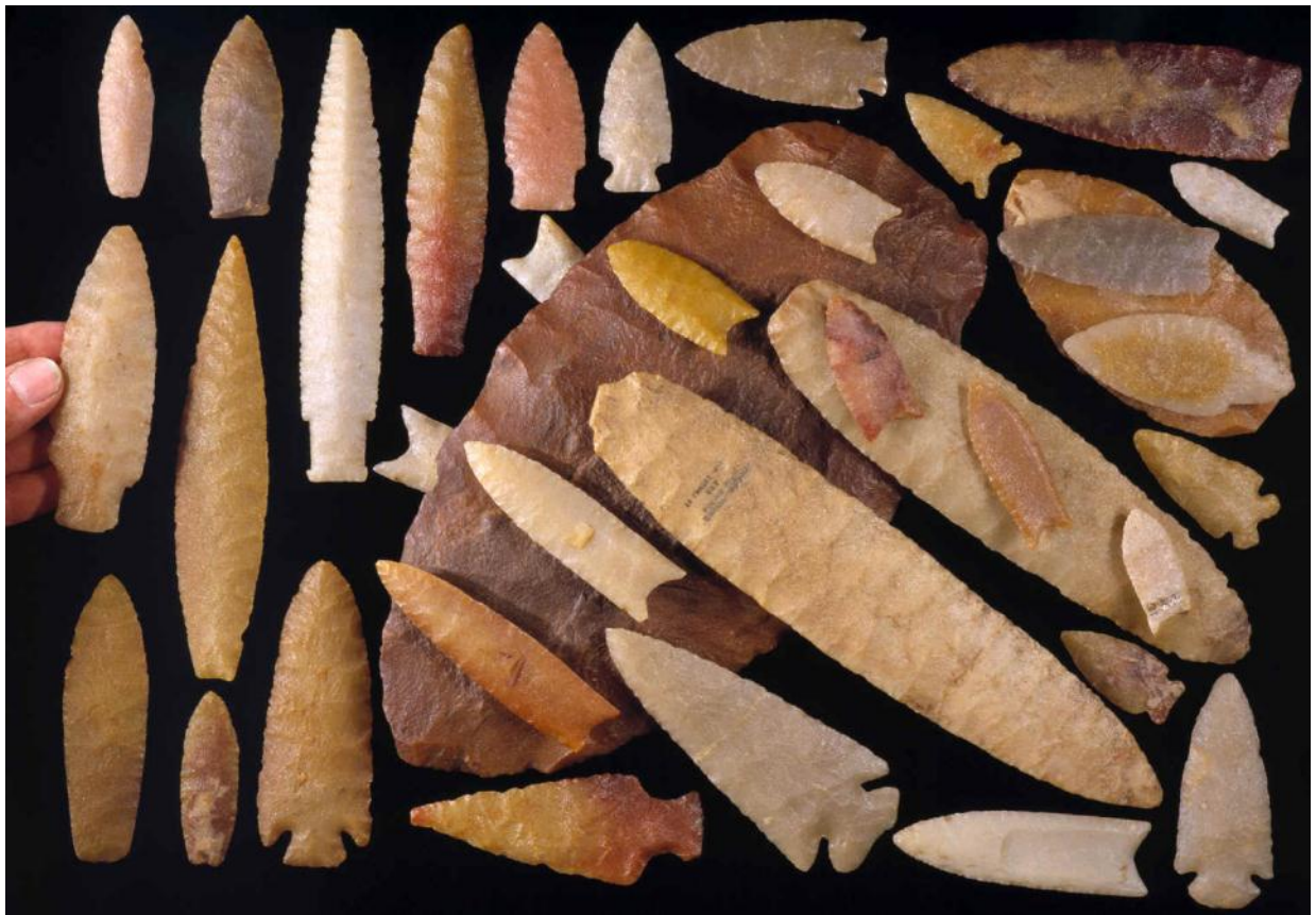
Культура Кловис. Северная Америка

Культура Кловис — доисторическая культура самого конца палеолита, распространенная на территории Северной и Центральной Америки. Культура Кловис была кратковременной – появилась 13 200 лет назад, закончилась 12 800 лет назад. Характеризуется весьма качественными орудиями труда и охоты.