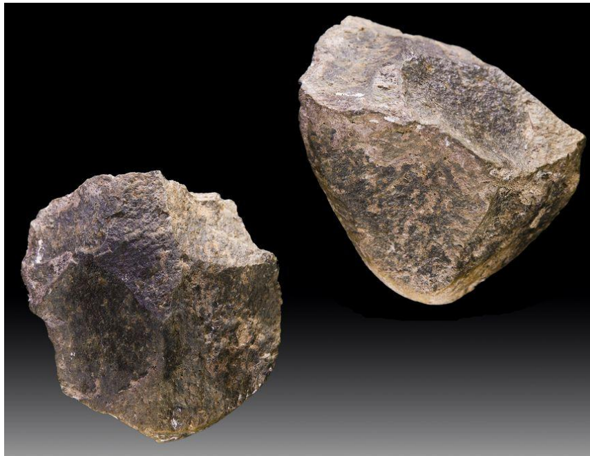
Олдувайские орудия. Африка

Около 1,7 млн.л.н. в Африке появились ашельская культура каменных индустрий, с заметным резким изменением технологии обработки камня и форм орудий. Принципиальным их отличием от олдувайских индустрий является развитие технологий получения крупных сколов-заготовок, появление группы специализированных макроорудий – ручных рубил, кливеров и пиков, а также более разнообразного набора мелких орудий (скребла, скребки, остря).