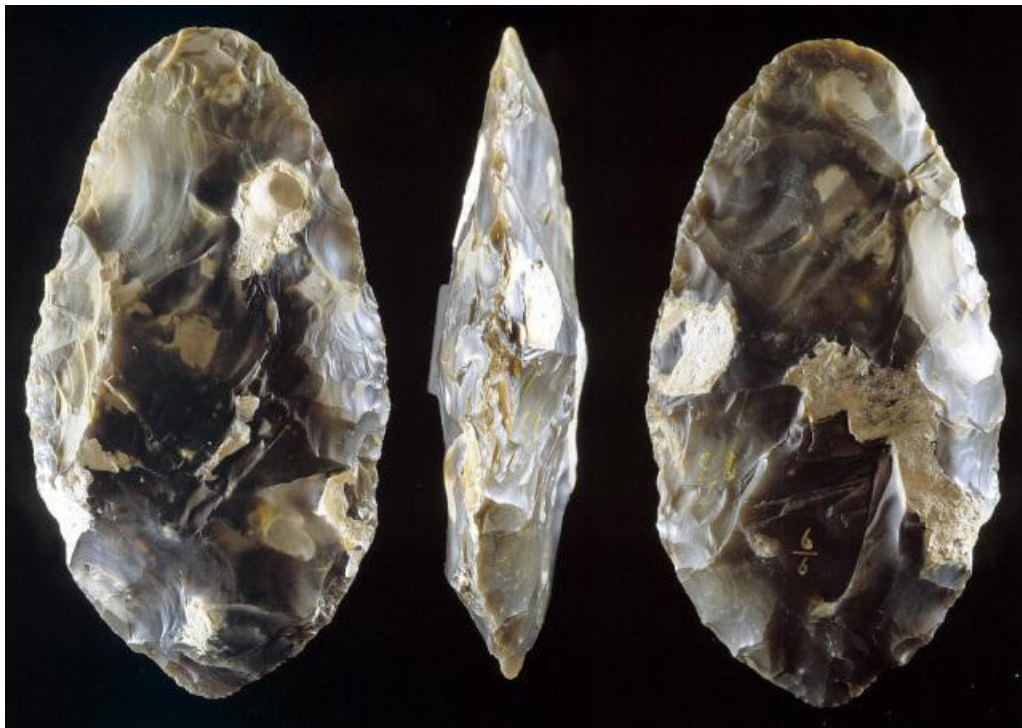
Ашельское орудие. Франция

Ранний ашель обнаруживается только в Африке, а также на Ближнем Востоке и на Кавказе. Средне- и позднеашельские индустрии распространены – в Африке, Европе и Азии вплоть до островов Ява и Флорес в Индонезии. Появление ашельской культуры совпадает с появлением вида Человек прямоходящий ( Homo erectus ).